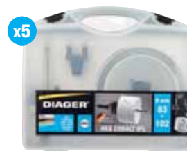
Allround Quick-lock lochsägen kassette 651E