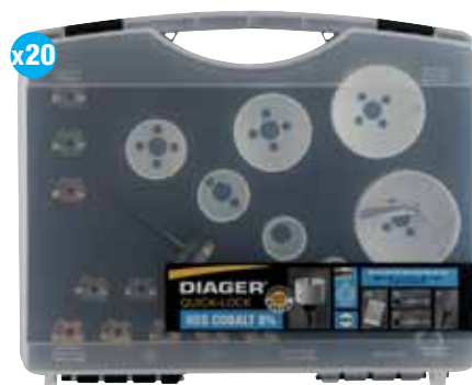
Allround quick-lock lochsägen kassette 656C