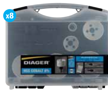
Elektro-lochsägen kassette II 657C