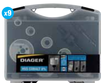
Sanitär-lochsägen kassette 653C