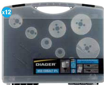
Allround lochsägen kassette 655C