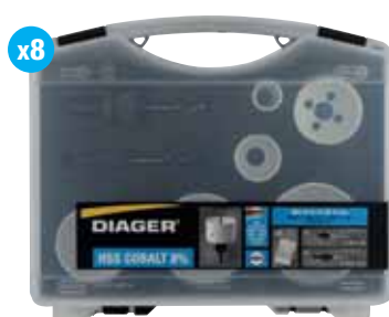
Elektro-lochsägen kassette I 654C