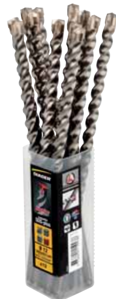
Verpackung mit 6,12,25 Bohrer