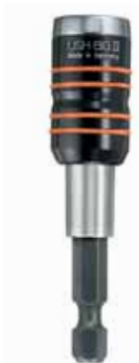
DIN 3126 E6,3