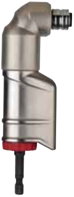
DIN 3126 E6.3